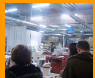
Montélimar-France: 2 Décembre 2005 Visite d'une « nougaterie »: fabrication du «Nougat de Montélimar».

différente d'un pays à l'autre et la traduction des critères choisis dans la langue nationale de chacun posent des problèmes importants. Ces critères ont alors été retravaillés. Pour conclure ces deux journées, une visite d'une des plus grandes « nougateries » de Montélimar a été organisée, pour le plus grand plaisir des gourmands.