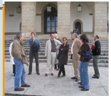
Cáceres - Espagne: 15 Avril 2004 Après la 1ère Réunion, visite guidée du centre historique.

Les réunions transnationales sont des moments essentiels car elles permettent aux partenaires de se rencontrer et de débattre des activités, des analyses et des avancés du projet. Elles permettent aussi d'approfondir et d'échanger des idées et des connaissances professionnelles et personnelles entre les participants. Ce sont aussi des occasions de découvrir et de connaître les territoires et les cultures