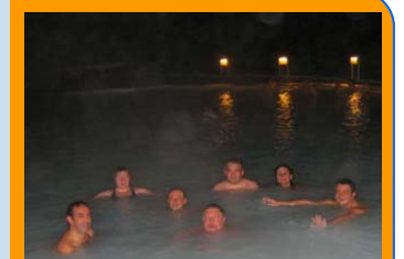
Reykjavík - Islande: 10 Décembre 2004 Après la 2ème réunion transnationale, baignade dans le lac bleu.